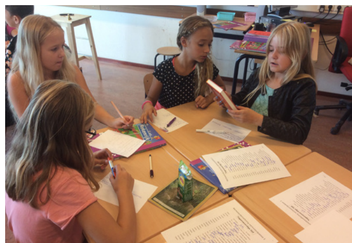
Speeddaten met boeken: een groot succes!

Bibliotheek Kennemerwaard op school is belangrijk, omdat planmatige en professionele leesbevordering één van de kernfuncties is van de bibliotheek en bijdraagt aan maatschappelijke meerwaarde.